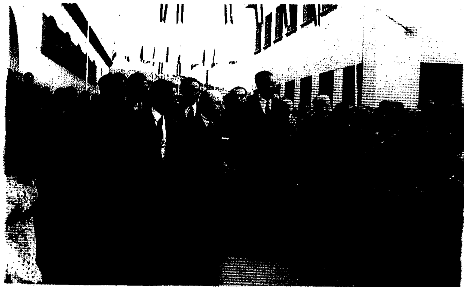
Aglomeración de vecinos y alumnos para ver al Ministro y su séquito